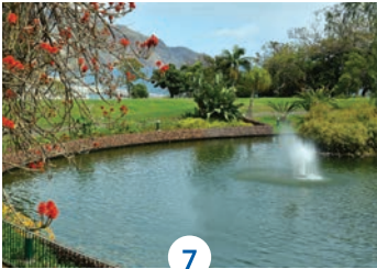
PARQUE DE SANTA CATARINA 📍 Avenida do Infante ☎ 291 231 502

Exibe o espólio encontrado nas escavações arqueológicas realizadas na antiga casa do mercador flamengo João Esmeraldo e regista a importância do comércio do açúcar no crescimento da cidade.