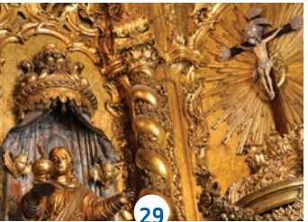
SÉ DO FUNCHAL 📍 Avenida Arriaga ☎ 291 228 155

Antigo palacete do século XVIII, exibe uma notável coleção de espécies de fauna, flora e geologia do Arquipélago, um Aquário e um agradável jardim de plantas aromáticas e medicinais.