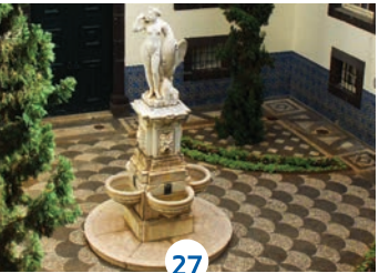
CÂMARA MUNICIPAL DO FUNCHAL 📍 Praça do Município ☎ 291 211 000

Parque pleno de história, possui uma grande variedade de espécies florais de diversas origens, onde também encontramos a Capela de Santa Catarina, uma das primeiras construídas na ilha.