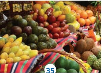
MERCADO DOS LAVRADORES 📍 Rua Brigadeiro Oudinot ☎ 291 214 080

Antiga moradia dos Condes de Carvalhal construída em 1758, oferece visita ao pátio interior, com um pequeno chafariz, aos salões em estilo barroco e à torre, com uma vista privilegiada sobre a cidade.