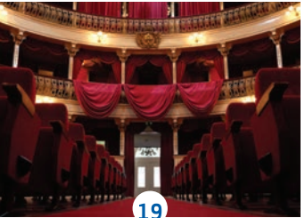
TEATRO MUNICIPAL BALTAZAR DIAS 📍 Avenida Arriaga ☎ 291 215 130

Com estreitas ruas de calçada e fachadas de casas antigas, as suas portas pintadas oferecem um dos postais mais originais da cidade. Aqui encontra vários restaurantes e bares.