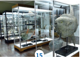
MUSEU DE HISTÓRIA NATURAL 📍 Rua da Mouraria, 31 ☎ 291 229 761

Montra de produtos locais e palco de eventos que promovem a cultura regional, onde as cores, os aromas e a tradição se misturam e encantam os inúmeros visitantes.