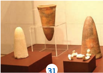
MUSEU A CIDADE DO AÇÚCAR 📍 Praça do Colombo, 5 ☎ 291 236 910

Magnífico monumento do século XVII, é considerada uma das igrejas mais ricas da ilha. Destaque para a requintada coleção de retábulos em talha dourada, os azulejos da sacristia e a visita à torre.