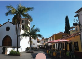
ZONA VELHA 📍 Rua de Santa Maria ☎ 291 705 060 > visitas guiadas

Edificada em 1514, no centro da cidade, esta emblemática igreja, praticamente inalterada desde a sua construção, com uma fachada simples, destaca-se pelo seu teto, um dos mais belos de Portugal.