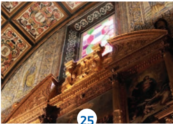
IGREJA DO COLÉGIO DOS JESUÍTAS 📍 Praça do Município ☎ 291 705 060 > visitas guiadas

Magnífico monumento do século XVII, é considerada uma das igrejas mais ricas da ilha. Destaque para a requintada coleção de retábulos em talha dourada, os azulejos da sacristia e a visita à torre.